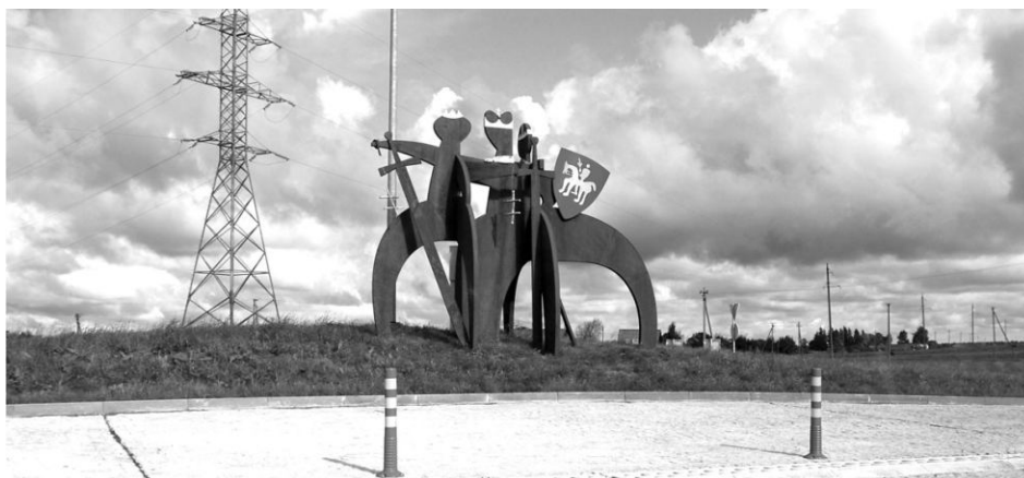
f) 2 / 52 .....