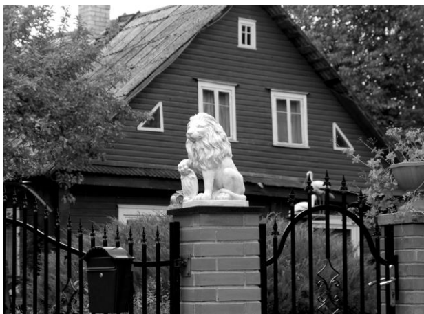
c) 4 / 11 .....