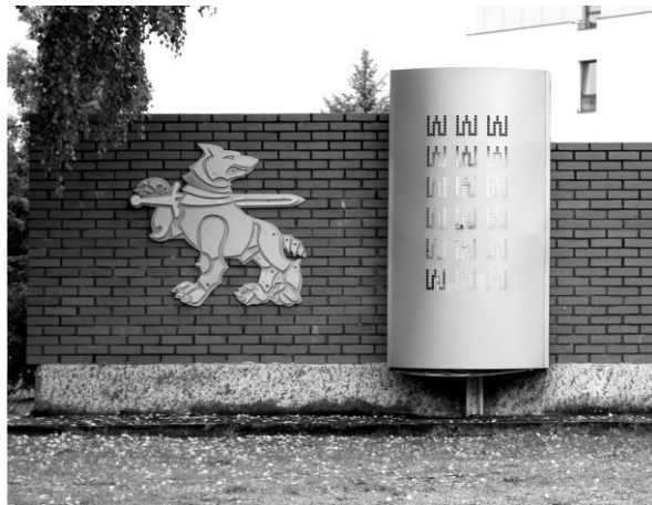
b) 2 / 8 .....