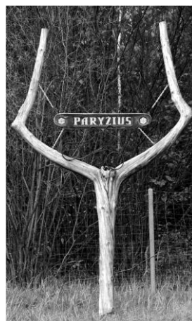
d) 1 / 30 .....