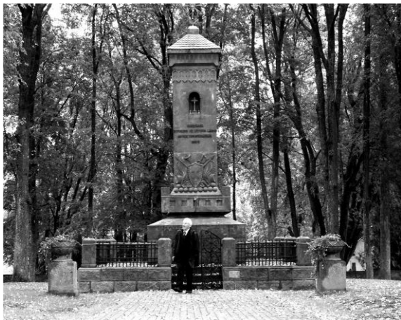
a) 3 / 6 .....

6. Atpažinti nuotraukose esančius vaizdus ir parašyti kurio etapo/atkarpoje tai yra: Pvz: 1/15 ar 4/38 po 15 bt